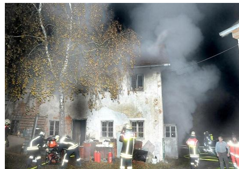
Brand einer alten Schiede in Hampersdorf am 10.11.