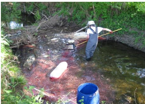
Öl auf der Goldach in Schwindkirchen am 09./10.05.