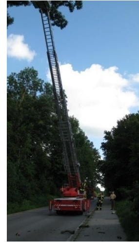
Baum droht auf B 15 zu fallen am 26.06.