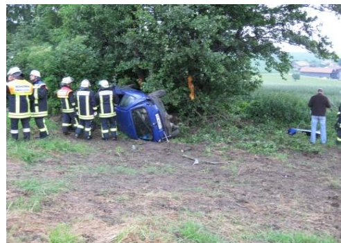
VU bei Schwindkirchen am 20.06.