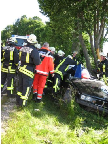
VU auf B15 zwischen Scheideck und Jaibing am 13.06.