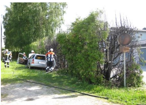
Brand einer Hecke und eines PKW in Kloster Moosen am 21.05.