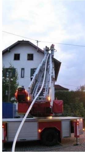
Dachstuhlbrand in Watzling am 26.08.